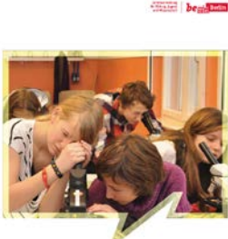
Berliner Schulwegweiser Wohin nach der Grundschule? Schuljahr 2014/2015

http://www.berlin.de/sen/bildung/bildungswege/uebergang.html