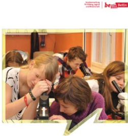
Berliner Schulwegweiser Wohin nach der Grundschule? Schuljahr 2014/2015

http://www.berlin.de/sen/bildung/bildungswege/uebergang.html