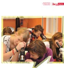
Berliner Schulwegweiser Wo hin nach der Grundschule? Schuljahr 2015/2016

http://www.berlin.de/sen/bildung/bildungswege/uebergang.html