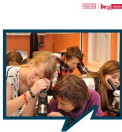
Berliner Schulwegweiser Wohin nach der Grundschule? Schuljahr 2016/2017

http://www.berlin.de/sen/bildung/schule/bildungswege/uebergang-weiterfuehrende-schule/